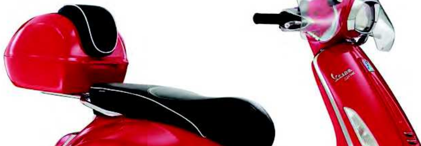
NERO/BLACK 1B001189000N VESPA SPRINT SPORT CM273109

Used in conjunction with the chromed rear luggage rack, this stylish accessory complete the looks of the Vespa and makes it even more unique.