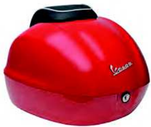
ROSSO PASSIONE cod. 1B00001600R7