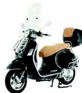
KIT CROMATO COMPLETO Chrome complete protection bars kit cod. 602959M

Used in conjunction with the chromed rear luggage rack, this stylish accessory complements the looks of the Vespa and makes it even more unique.