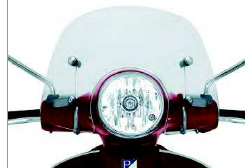
CUPOLINO TRASPARENTE Transparent flyscreen cod. 606008M

Windscreen made in high quality, impact resistant methacrylate. Brackets finishing in line with the style of the vehicle. Offers effective protection against the weather and excellent visibility. Also available as medium sized version (1B001598).