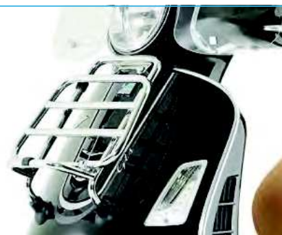
PORTAPACCHI ANTERIORE CROMATO Chromed front rack cod. 1B001482

The chromed top box support is a functional accessory which, designed with stylish looks to enhance the designs of the vehicle. It allows 1B000016 top box mounting on the Vespa GTS. The high quality chrome finishing ensures superior durability.