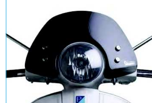
CUPOLINO FUMÈ Smoked flyscreen cod. 1B001600

Clear flyscreen in superior quality impact-resistant methacrylate. This medium sized shield offers effective protection and complements the style of the vehicle.