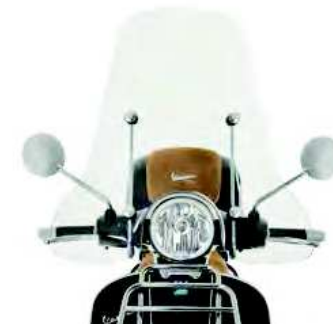
PARABREZZA Windscreen cod. 1B001446

A kit offering protection for the bodywork against bumps and knocks while accentuating the looks of the Vespa GTS. Includes front luggage rack, rear outline guard and front mudguard bumper, all with chrome finish and Vespa logo.