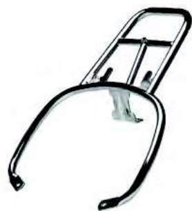
SUPPORTO BAULETTO CROMATO Top box chromed support cod. 657081

Painted top box, with backrest in the same material and finish as the saddle. Fresh, modern design complementing the soft, flowing forms of the Vespa. It can hold one flip up helmet or two jet helmets.