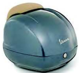
GRIGIO DOLOMITI cod. CM273337